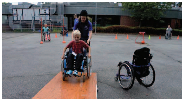
Ausprobieren des Rolliparcours