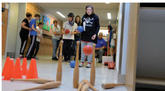
Kegelspaß auch im Trockenen