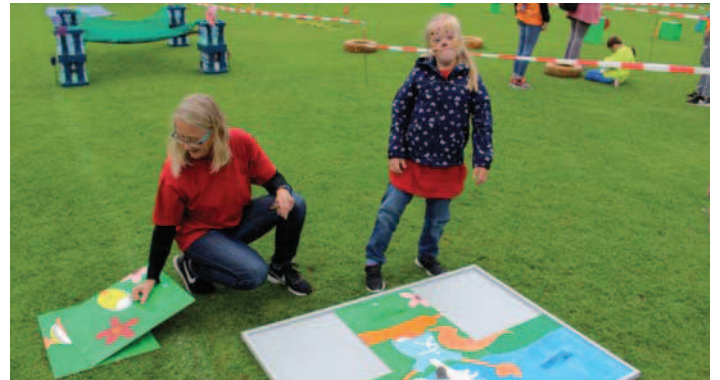
Maskottchen Spurti war beim Spielfest beliebtes Motiv