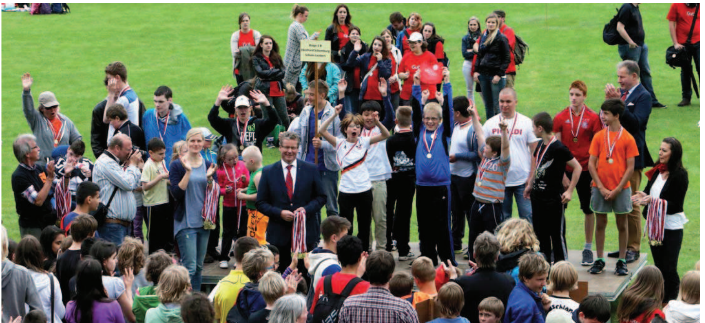
Siegerehrung mit Ehrengästen