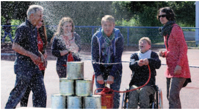
Wasserspritze im Einsatz