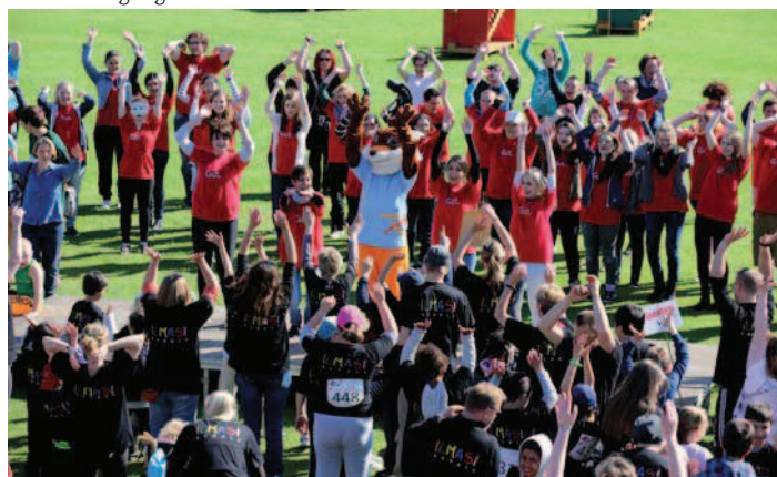
Aufwärmen mit SPURTI