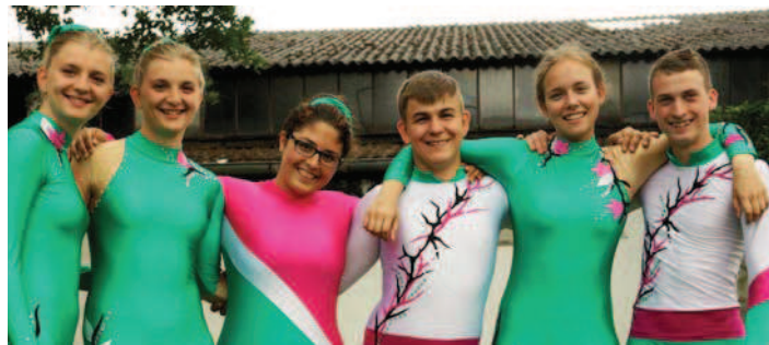
Bild oben rechts: Freude bei den jungen RVClern über den neuen Voltigiergurt